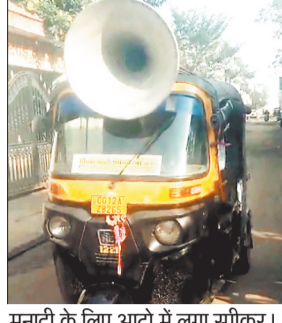
मुनादी के लिए आटो में लगा स्पीकर।

एसईसीएल दीपका प्रबंधन व प्रशासन द्वारा प्रभावित ग्राम हरदीबाजार में मकानों व परिस्परतियों की नापी सर्वे के लिए कोटवार से मुनादी कराई गई। वहीं दूसरी ओर नापी सर्वे के विरोध में ग्रामवासियों ने बैठक कर एसईसीएल के दबाव के विरोध में जनजागरण रैली निकाल कर विरोध जताया।