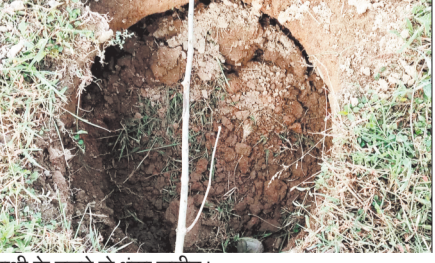
हाथी के चलने से धंसा जमीन।

ग्रामीण को मौत के घाट उतार दिया था। जिसके बाद वन विभाग की टीम एक्शन में आयी और हाथियों के उत्पात को रोकने के लिए जंगल में निगरानी बढ़ाई। निगरानी में दौरेन निगरानी दल को झुंड के शामिल एक दंतैल हाथी कुछ अलग