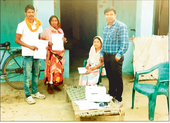
ग्रामीण के घर पहुंचे बीएलओ।

वर्ष 2003 के मतदाता सूची में नाम खोजने के लिए भी बीएलओ नहीं कर रहे सहयोग