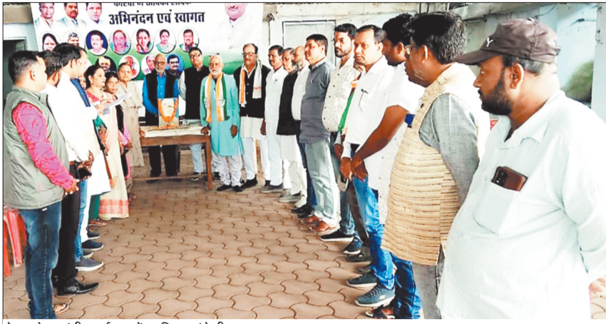
नेहरू के जयंती कार्यक्रम में शामिल कांग्रेसी।