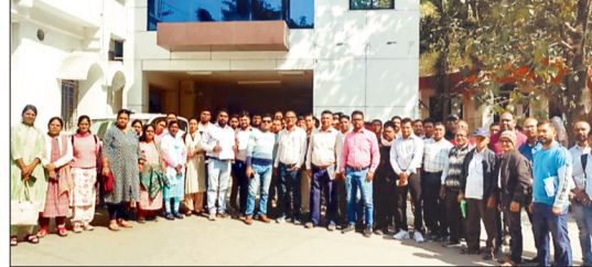
कलेक्टर के बाहर खड़े ग्रामीण कृषि विस्तार अधिकारी।

31 लाख मीट्रिक टन धान खरीदी का लक्ष्य लेकर शनिवार से सभी उपार्जन केंद्रों में धान खरीदी के लिए प्रशासन ने पूरी तैयारी करते हुए सभी केंद्रों में प्रभारी अधिकारियों की नियुक्ति कर दी है इसके तहत सभी 65 उपार्जन केंद्रों में सहकारिता निरीक्षक से लेकर सहायक कृषि विस्तार अधिकारी, ग्रामीण कृषि विस्तार अधिकारी, खाद