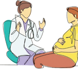
संतान का न होना, पुरुष अथवा महिला किसी का भी नसबंदी का होना आदि के बारे में जानकारी दी जायेगी।

माखीजा टेस्ट ट्यूब बेबी सेंटर के तत्वाधान में कोरबा में निःसंतान दंपतियों के लिए निःशुल्क परामर्श शिविर का आयोजन किया गया है। यह शिविर दिनांक 16 नवम्बर को रविवार समय 11:00 बजे से 2:00 बजे तक डॉ. रोहित खेरे, नवजीवन नर्सिंग होम, कोसाबाड़ी, कोरबा, छत्तीसगढ़ में आयोजित होगा। शिविर में आने के लिए 8109037050 पर फोन करके अंतिम पंजीयन करना आवश्यक है। इस शिविर में नलियों में स्काउट व अन्य कोई खराबी होना,